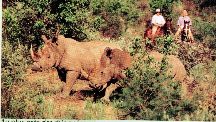
Au plus près des rhinocéros

les galops sont moins rapides pour pouvoir s'arrêter à tout instant si nous arrivons au milieu de lions ou d'éléphants... Nos guides aiment le cross et nous sautons souvent les nombreux troncs d'arbres abattus par les éléphants.