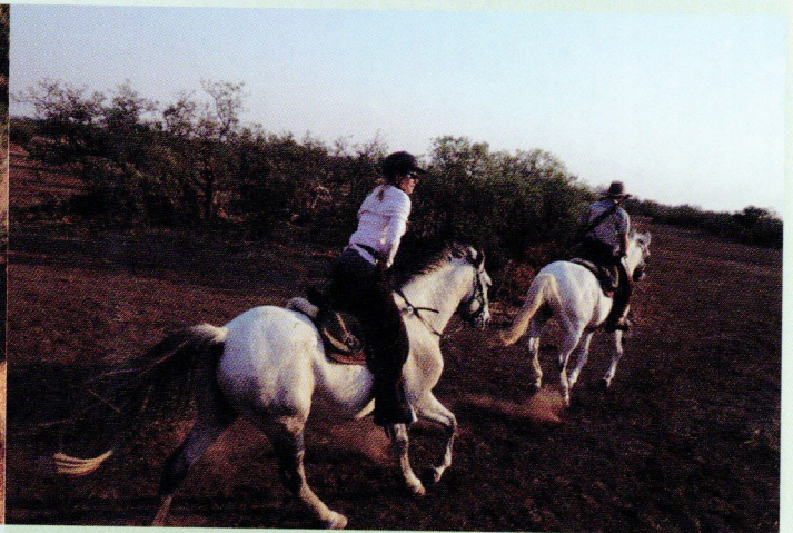
Au galop derrière notre guide... armé !