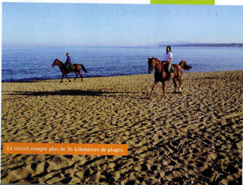
Le circuit compte plus de 35 kilomètres de plages.

Cette journée s'achève à Santu Lussurgiu (plus facile à écrire qu'à prononcer, essayez!). Dans ce village médiéval, niché au cœur d'un ancien cratère volcanique, nous découvrons de belles maisons colorées avec leurs balcons en fer forgé. Plus insolite, l'une des deux églises du bourg est décorée des signes et drapeaux de l'ordre de Malte, témoignant du passé mouvementé et de l'importance stratégique de la Sardaigne. Nous laisserons les chevaux dans une pâture proche de ce village tout en pierres, avant de retourner à notre hébergement en voiture. C'est d'ailleurs l'un des points forts de cette randonnée; chaque soir, nous laissons les chevaux dans un pré différent, et nous les retrouvons le lendemain matin après une nuit passée à l'agriturismo. L'intérêt et la variété d'un itinéraire en ligne, avec le confort d'une rando en étoile! Nous poursuivons notre ascension dès le lendemain matin vers la crête du mont Ferru, à 1200 m d'altitude. Les oliviers ont désormais laissé la place à une forêt de résineux parsemée de fleurs sauvages, avec de larges chemins et pistes en sable, propices aux allures vives. Cette région reste très préservée, et il n'est pas rare de croiser des troupeaux de moutons. La vue sur toute la plaine centrale de l'île, et juste en dessous de nous le village de Santu Lussurgiu, est impressionnante. Nous laisserons ce soir les chevaux au